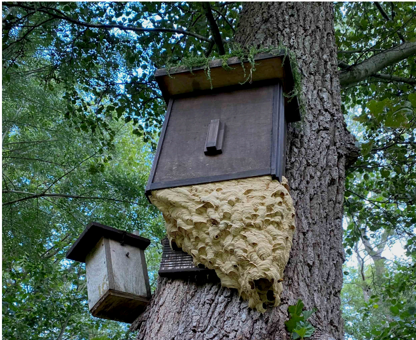
Europese hoornaars kraakten een vleermuis kast

Onze 'vogelmannen' onderhielden ook dit jaar de nest- en schuilkasten voor vogels en vleermuizen. Het nestkasten arsenaal werd verder uitgebreid met vogel- en vleermuis kasten. Eén vleermuis kast werd benut door een nest Europese hoornaars, een niet-invasieve, nuttige insectensoort.